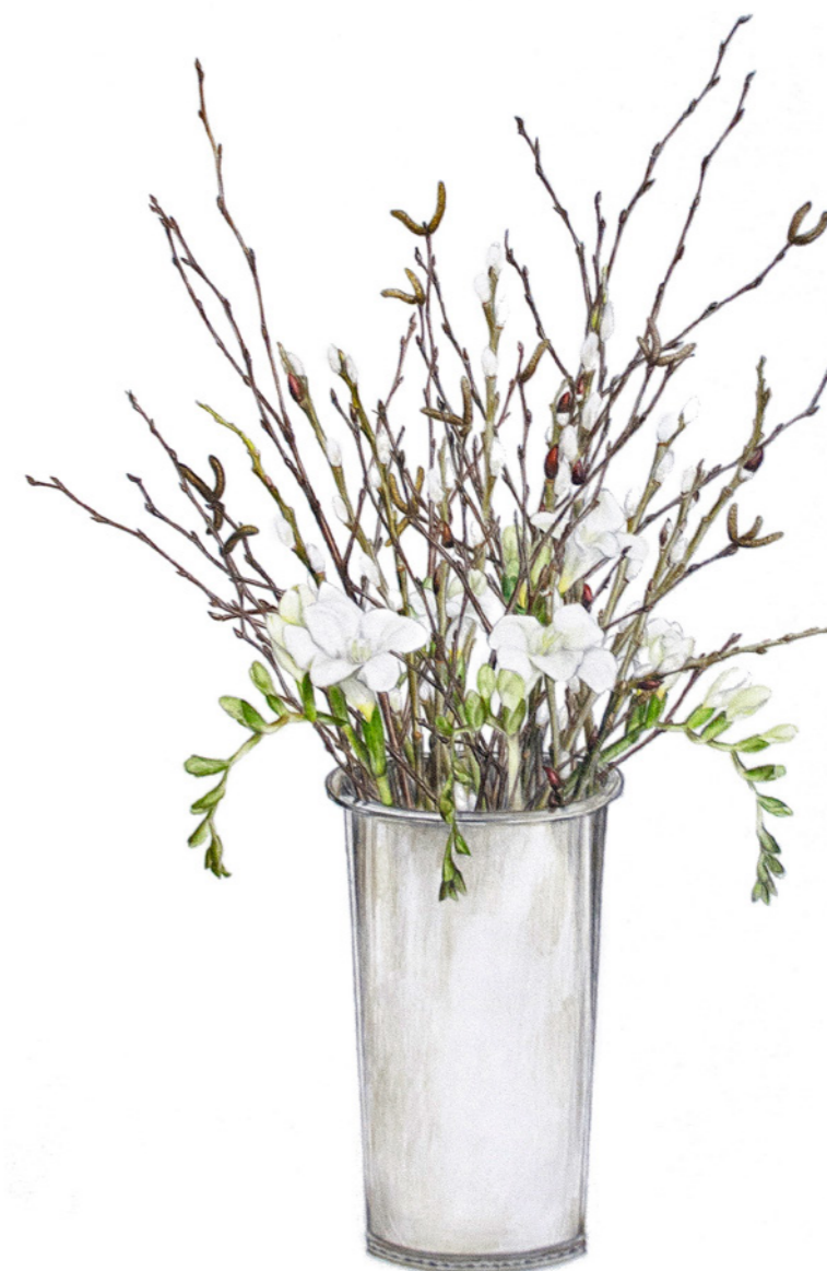
Fresia i bredbladet pil, birk, elletræ

”Det er spændende at tænke æstetik, kunsthåndværk, form, udtryk, miljø og bæredygtighed sammen i forberedelsen af forslag til nyanskaffelser.”