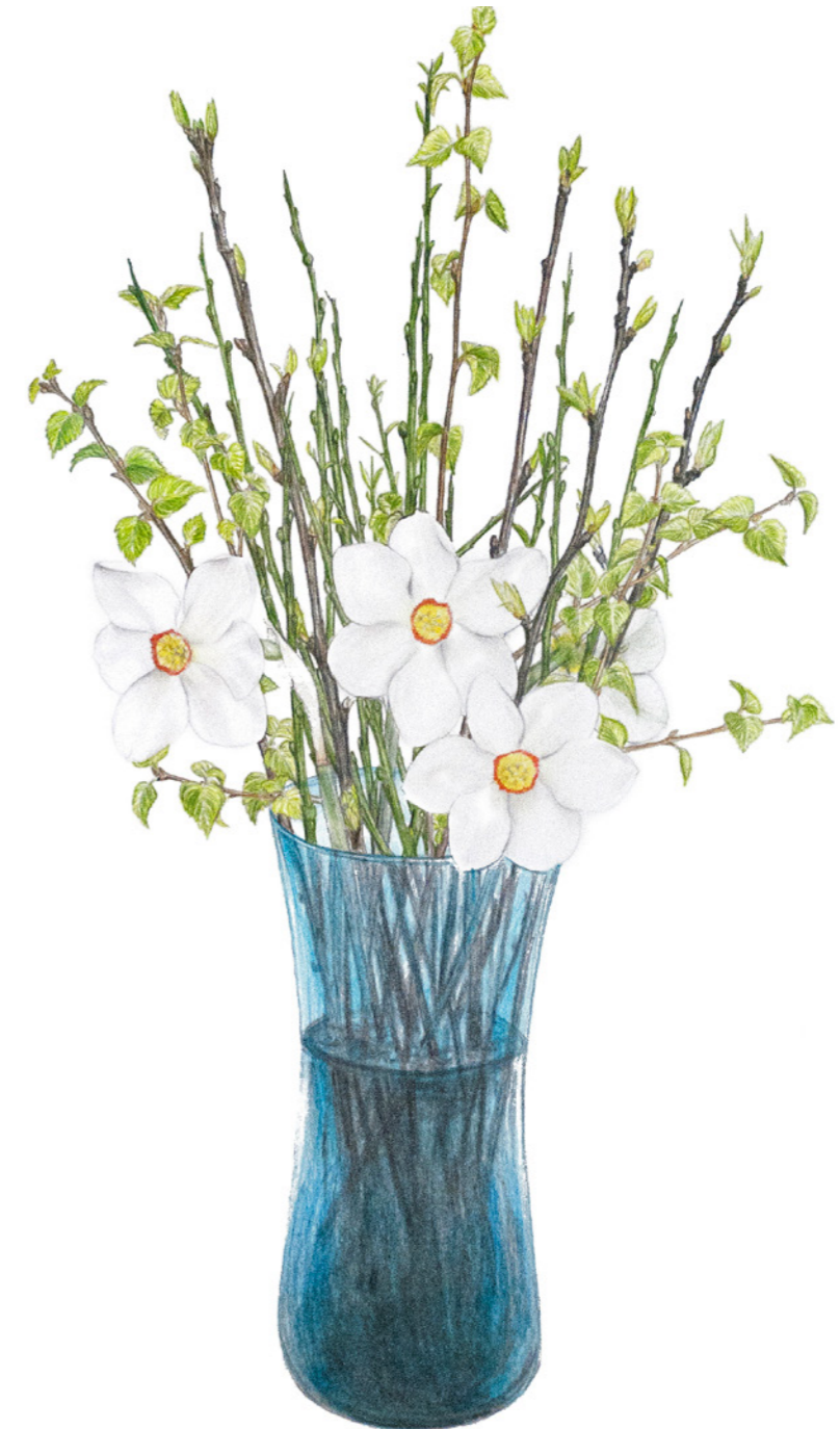
Pinselilje i birkekviste