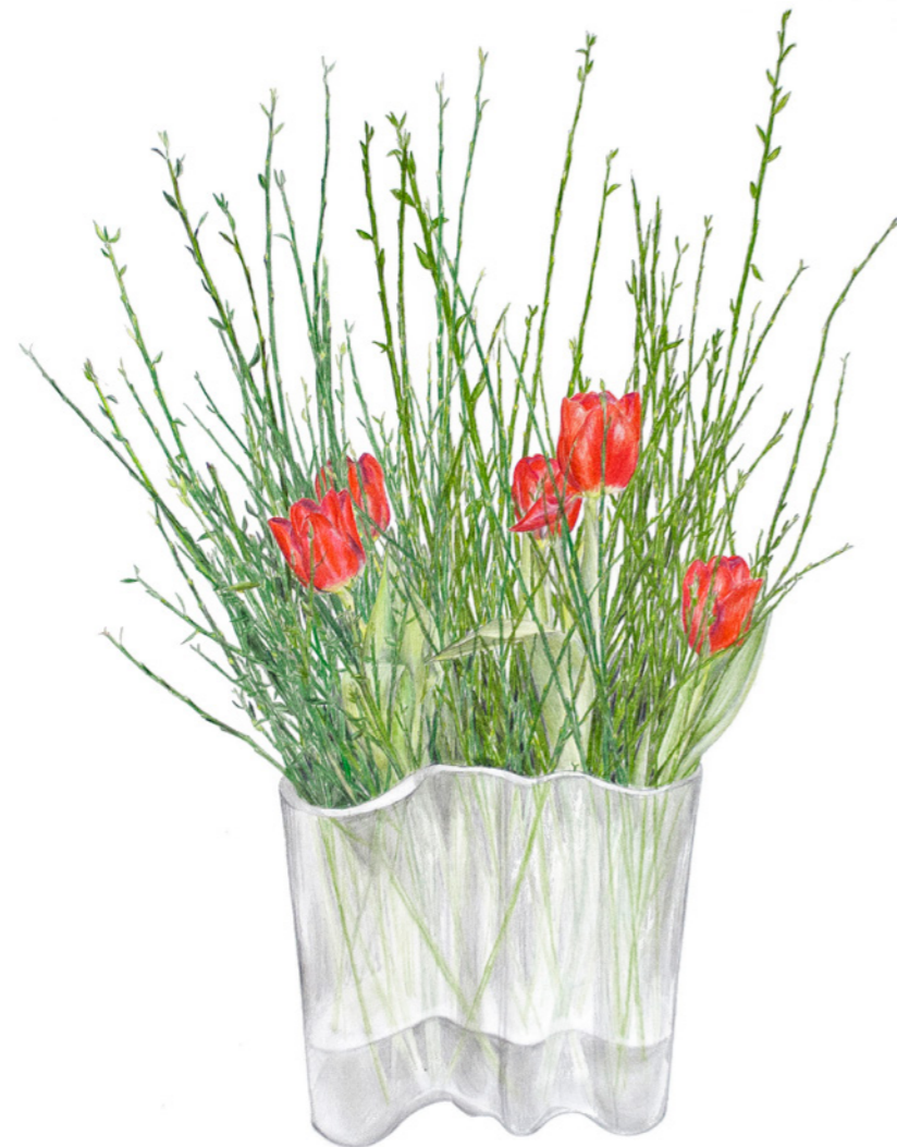
Tulipaner i grønt

Kirkeåret indledes med Advent en månedstid før kalenderåret. Adventstidens farve er violet, og mange kirker har violette bånd på adventskransen. Julens farve er hvid undtaget 2. juledag, som er martyrernes dag, Skt. Stefans dag, hvor farven er rød. Dansk tradition med flagets røde og hvide farver afspejler sig i mange private hjem, hvor adventskransen er pyntet med røde bånd og hvide lys, og dette går igen i nogle kirker. Der er ikke mange vinterblomster i Danmark, men julerosen er undtagelsen med sine hvide blomster. Mange danske gartnerier driver både tulipaner, amaryllis og andre velegnede blomster frem, ligesom man kan skære fra danske potteplanter i både hvidt, rødt og rødviolet. Troldgrene, silkefyr, kristtjorn, vintergrøn, kirsebærlaubær foruden