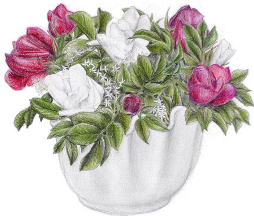
Vilde roser med brudeslør

Men først og fremmest er det smagen, der afgør valget, så man ikke risikerer en sur, dyr vin, som nok overholder de krav, menighedsråd og præst har sat, men ikke bidrager til den gode smagsoplevelse. Nadvermåltidet skulle gerne være en fest! Mange sogne har både saft og vin for at understrege, at nadveren er for alle.