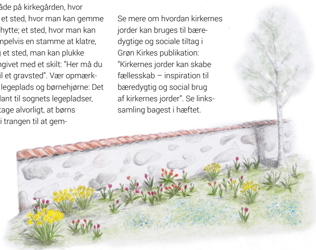
Kirkemur med forårsblomster

Se mere om hvordan kirkernes jorder kan bruges til bæredygtige og sociale tiltag i Grøn Kirkes publikation: "Kirkernes jorder kan skabe fællesskab – inspiration til bæredygtig og social brug af kirkernes jorder". Se linksamling bagest i hæftet.