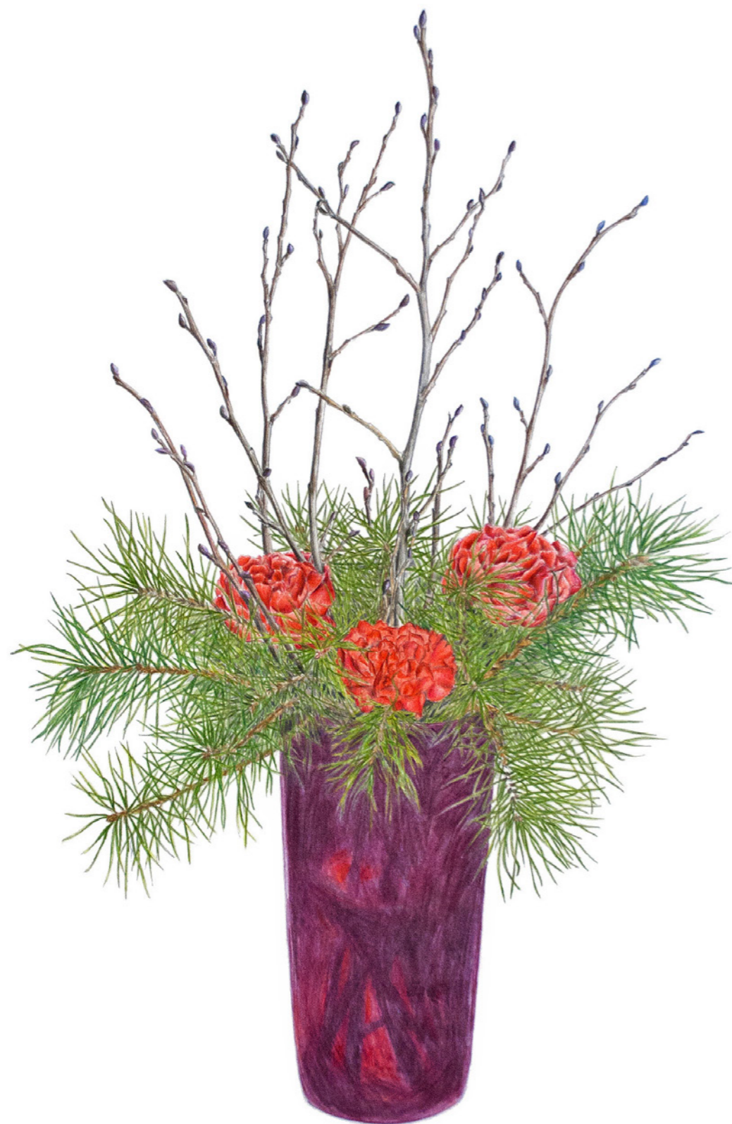
Nelliker i fyr