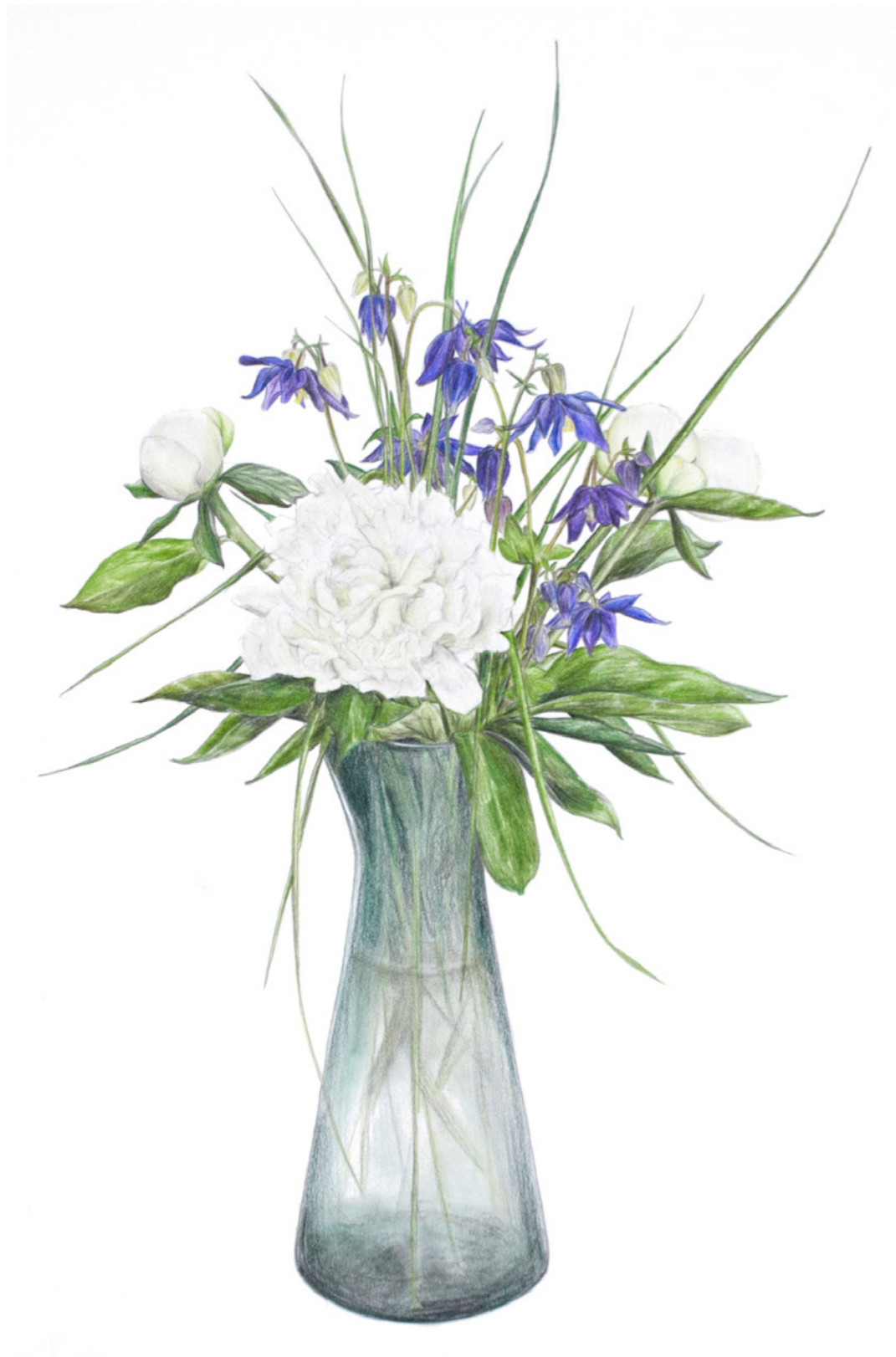
Pæon, akeleje og græs