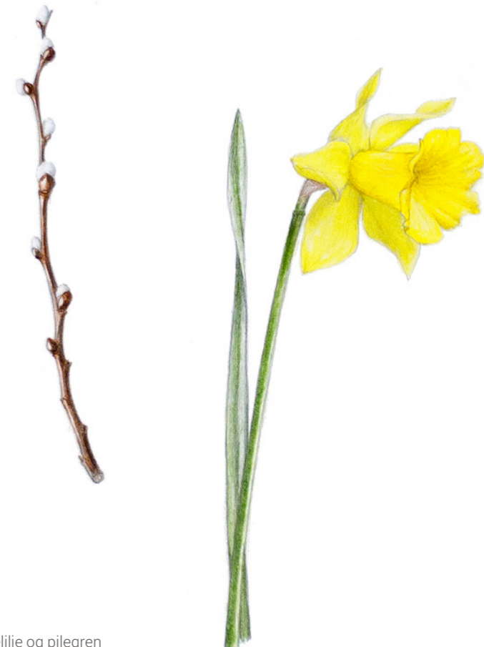
Påskelilje og pilegren

Påskens er narcissernes tid. De klassiske påskeliljer er de lysende, gule trompetnarcisser, men der findes også dværgnarcisser i mange hvide, gule og gyldne farver. Birkegrene er måske det første, man tænker på, når det handler om buketternes skelet i påsketiden, men der er også andre velegnede grene. Pilegrene med de såkaldte 'gæslinger' på spring er fine til at stikke i hér og dér.