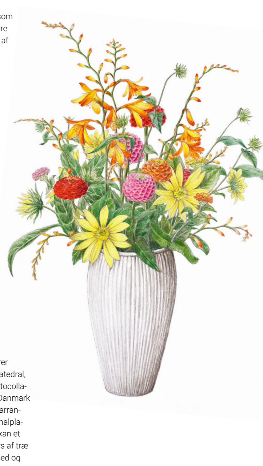
Montbretia, frøkenhat og septembersolsikke

Forud for pinsen, i pinsen eller i Trinitatistiden fejrer mange sogne gudstjeneste i det fri, i naturens katedral, og her giver udsmykningen oftest sig selv. Se fotocollagen med forskellige eksempler på side 16-17. I Danmark forhindrer blæsten ofte lette og luftige blomsterarrangementer udendørs, ligesom levende lys er ret malplacerede i dagtimerne og ofte blæser ud. I stedet kan et lille interimistisk alter med kalk og disk og et kors af træ eller sten fungere fint med naturens egen skønhed og frodighed som baggrund. Små halmballer kan bruges som bænke eller alterbord – eller hvordan traditionen er hos jer.