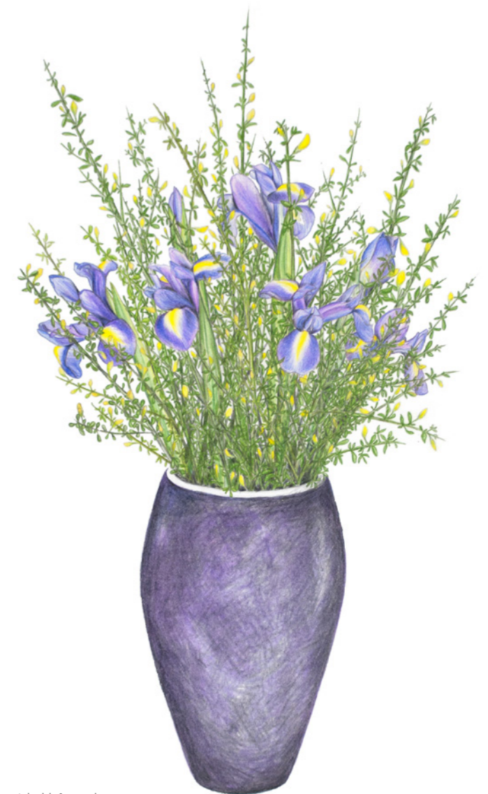
Iris i håret visse

“Hver blomst er i sig selv med form, farve og duft en lovsang til livets skaber.”