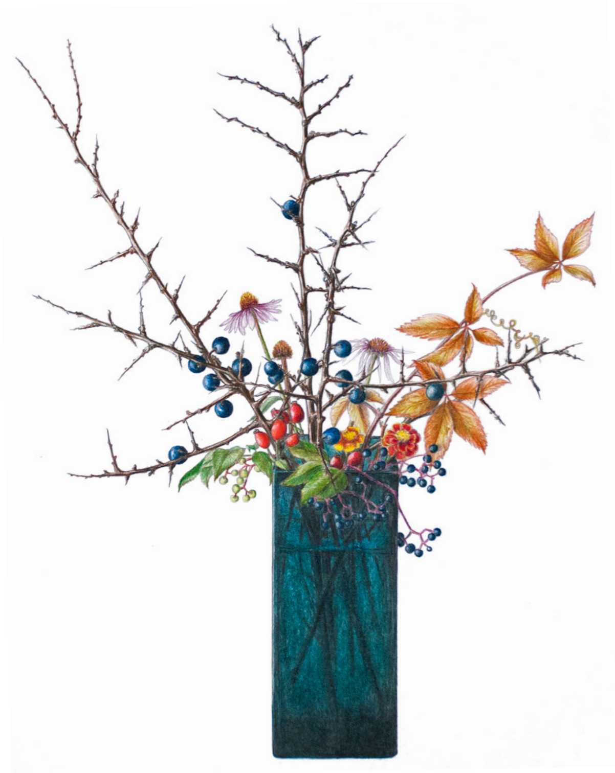
Slåen, rød solhat, tagetes, hyben, hylde og vildvin

Trinitatistiden skal der selvfølgelig bruges blomster i alle tænkelige farver – fra haven, kirkegården eller engen.