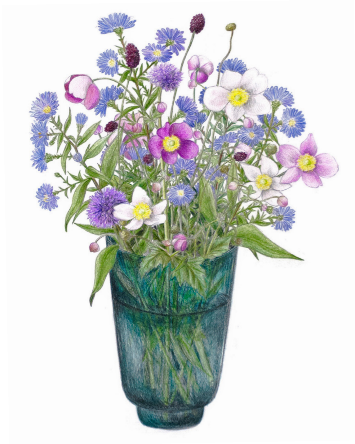
Høstanemone, læge-kvæsur, prydløg og høstasters