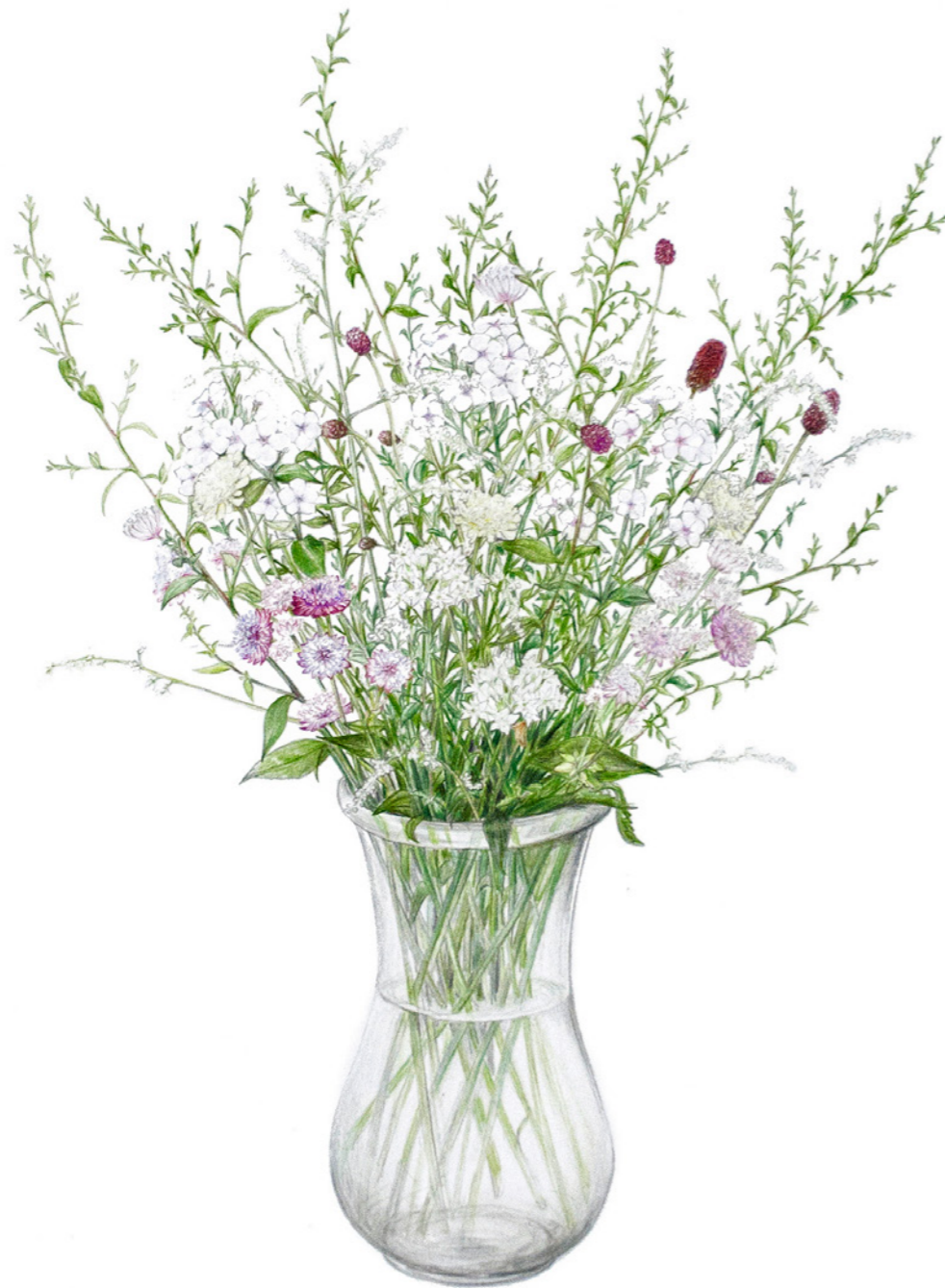
Snebynke, læge-kvæsur, hjertebladet asters, kinapurløg og skabiose