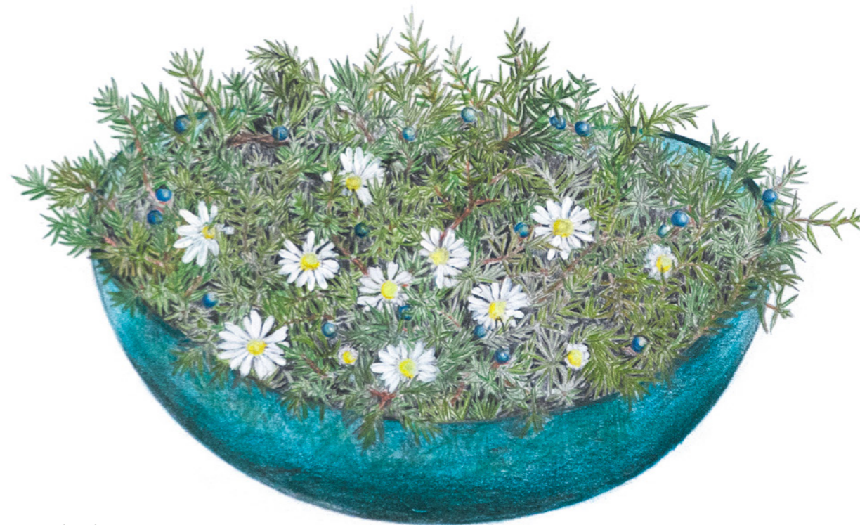
Krysantemum i enebær

Der er en god måde at tage vare på alle små, kortstilkede forårsblomster som skilla, anemone, vintergæk og erantis, hornviol, martsviol, stenbræk, vejbred og skovmærke: form hønsetråd til en flad bold, så den passer og udfylder en egnet skål. Hønsetråden fungerer som en god støtte. Husk at fylde vand i. Derefter dækker man nettet med mos, så det ligner en lille tue i skålen, hvori man stikker alskens forårsblomster, måske sammen med nogle pilegrene. Det kan være en god idé at lave små huller til blomsterne i mosdækket for ikke at skade stilkene, når de sættes i.