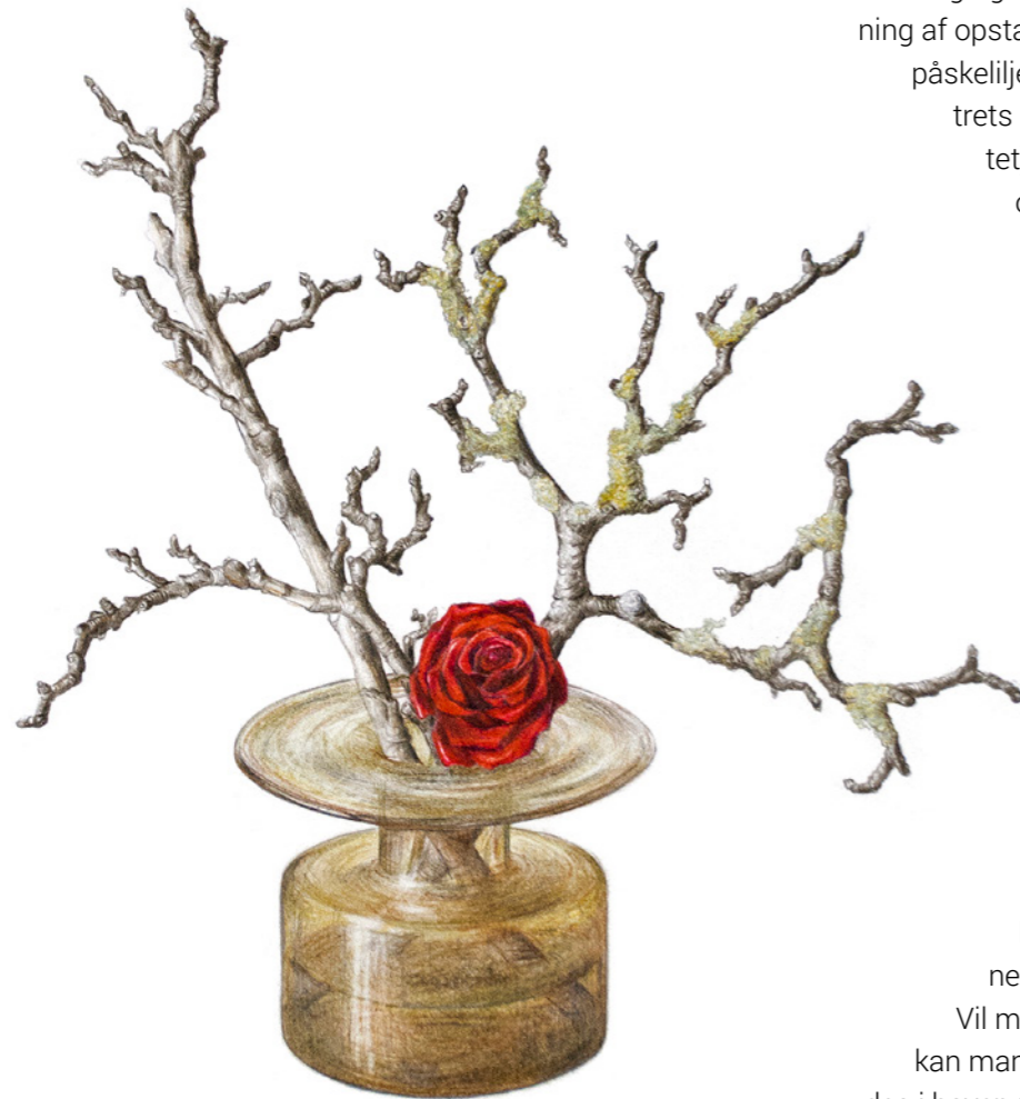
Æblegrene med rose

Trinitatis er en tid med vækst og modenhed inden for kirkeåret. Trinitatis søndag er en festdag, hvor den liturgiske farve er hvid. Trinitatistidens farve er ellers grøn. På Trinitatis søndag fejrer vi Treenigheden. Gennem hele