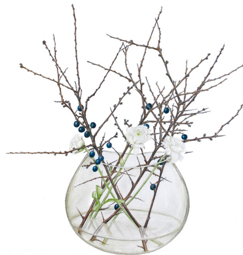
Ranunkler i slåen

nende ramme om kirkens aktiviteter. Om vinteren kan man supplere sine grene og stedsegrønne vækster med danske gartneres amaryllis og kalanchoë ("brændende kærlighed") og sidst på vinteren også klippe fra andre tidlige potteplanter som pelargonie.